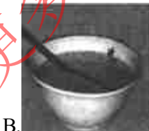
B. 筷子在水面处“折断”