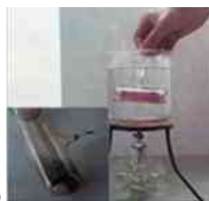
碘锤中碘颗粒变多